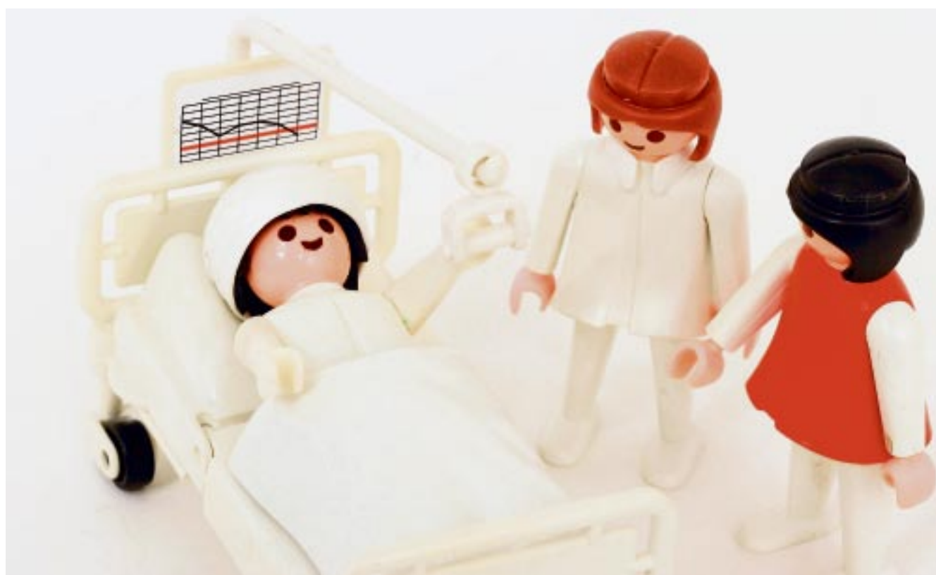
Medtech-Produkte, die das Wohlbefinden der Patienten verbessern und den Spitälern Kosten sparen, sind von den Investoren gesucht.

Tatsächlich ist die Orthopädieherstellerin ein Grenzfall. Synthes erwirtschaftet über 60% des Umsatzes in den USA. Zudem ist ein Teil der Produkte von den Rückvergütungsverträgen der Versicherer abhängig. Dies gilt ebenso für die Wettbewerber wie Stryker, Zimmer oder Medtronic. Allerdings ist die Marktposition von